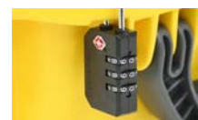
Lucchetto approvato TSA