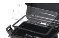
Kit pannelli Waterproof