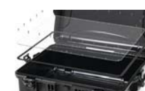
Kit pannelli Waterproof