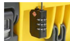
Lucchetto approvato TSA