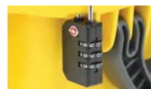
Lucchetto approvato TSA