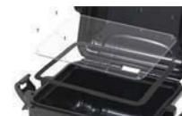
Kit pannelli Waterproof